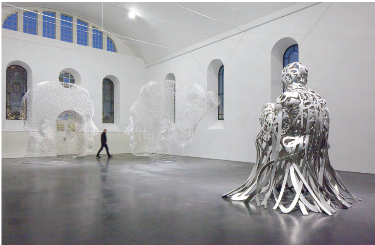
Jaume Plensa – Ausstellung in den Jakobshallen der Galerie Scheffel